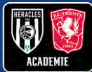
TWENTE HERACLES ACADEMIE